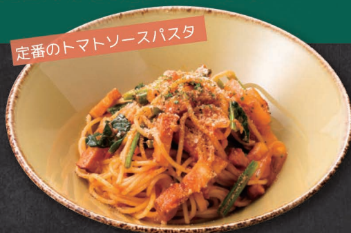
01. アマトリチャーナ Amatriciana ¥1,300