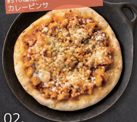
02. 大豆ミートのスパイスカレー Soy Meat Spice Curry ¥1,300