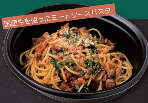
02. 国産牛のボロネーゼ Bolognese of Japanese beef ¥1,500