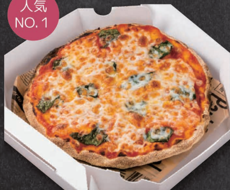
01. マルゲリータ Margherita ¥1,200